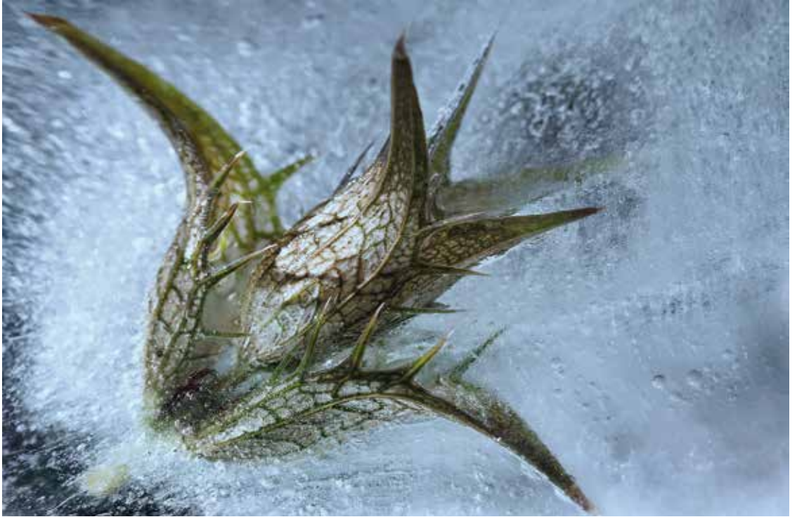
„Bizarre Schönheit“ von Monika Rösler ↑