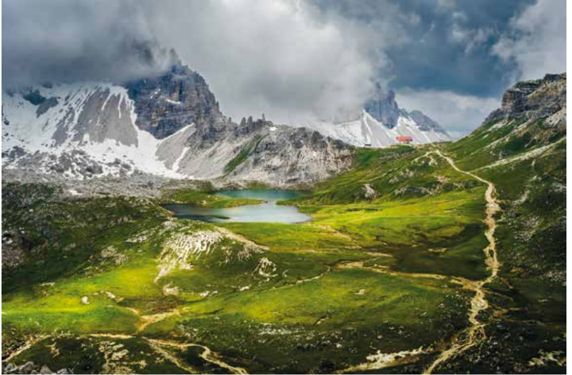
„In den Dolomiten“ von Robert Sprenger ↑