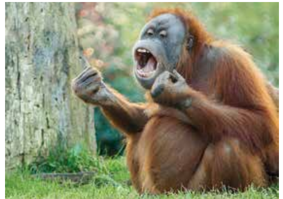
„Orang Utan“ von Robert Sprenger ↓