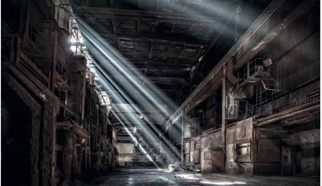
↑ Der letzte Strahl (3. Platz im 3. Quartalswettbewerb 2015 Bayern)