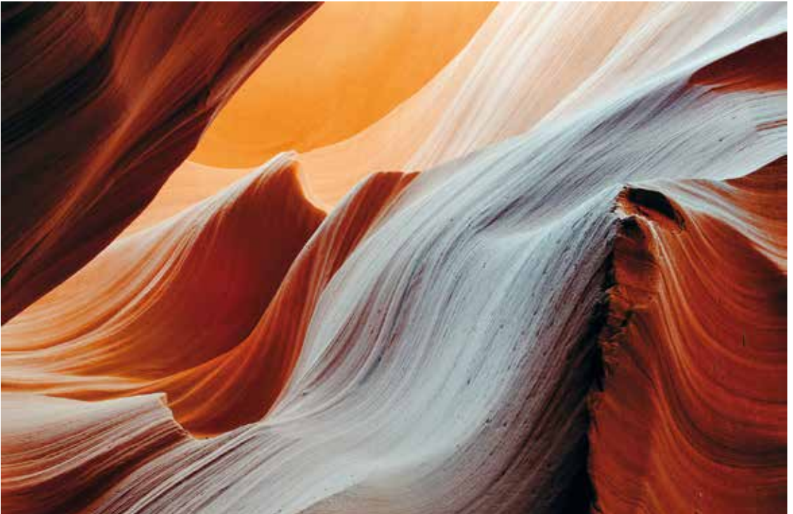
„Sandstone Waves“ von Robert Sprenger ↓