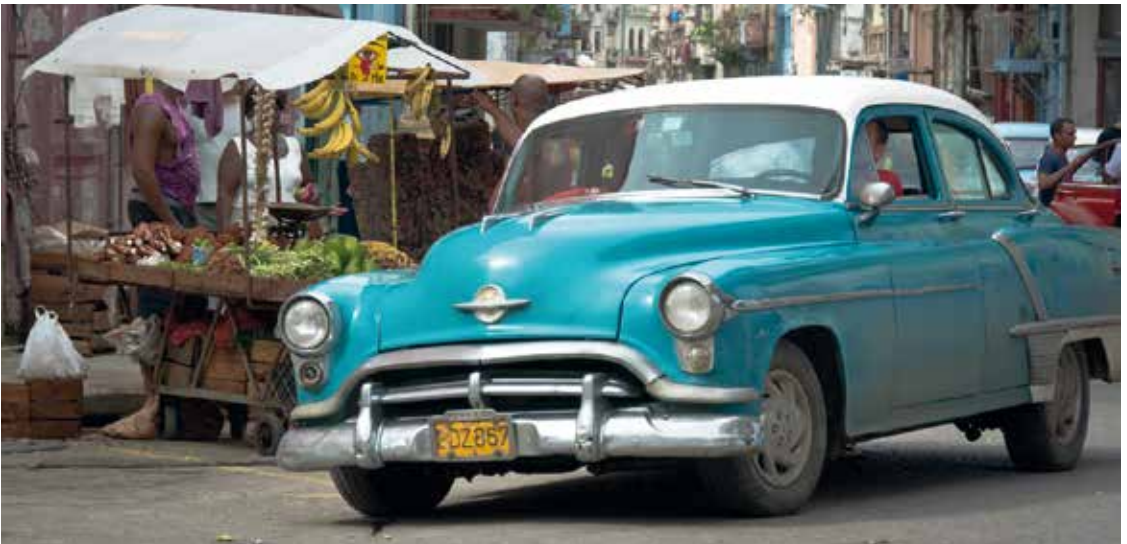
„Kuba“ von Dieter Eckert ↓