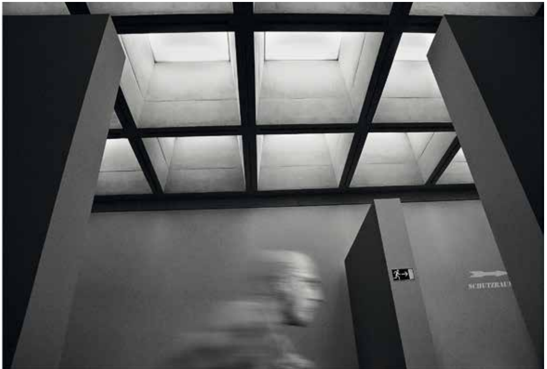
On the run (2 Annahmen beim German International „open“) ↓