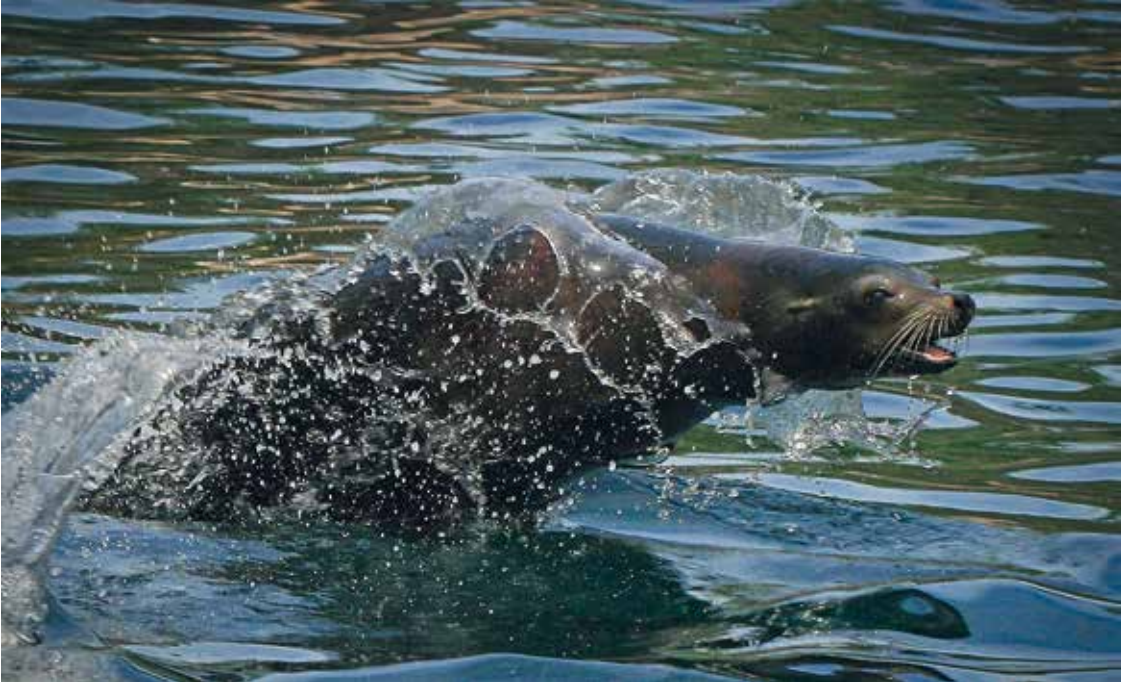
„Seelöwe“ von Piero Federico ↑