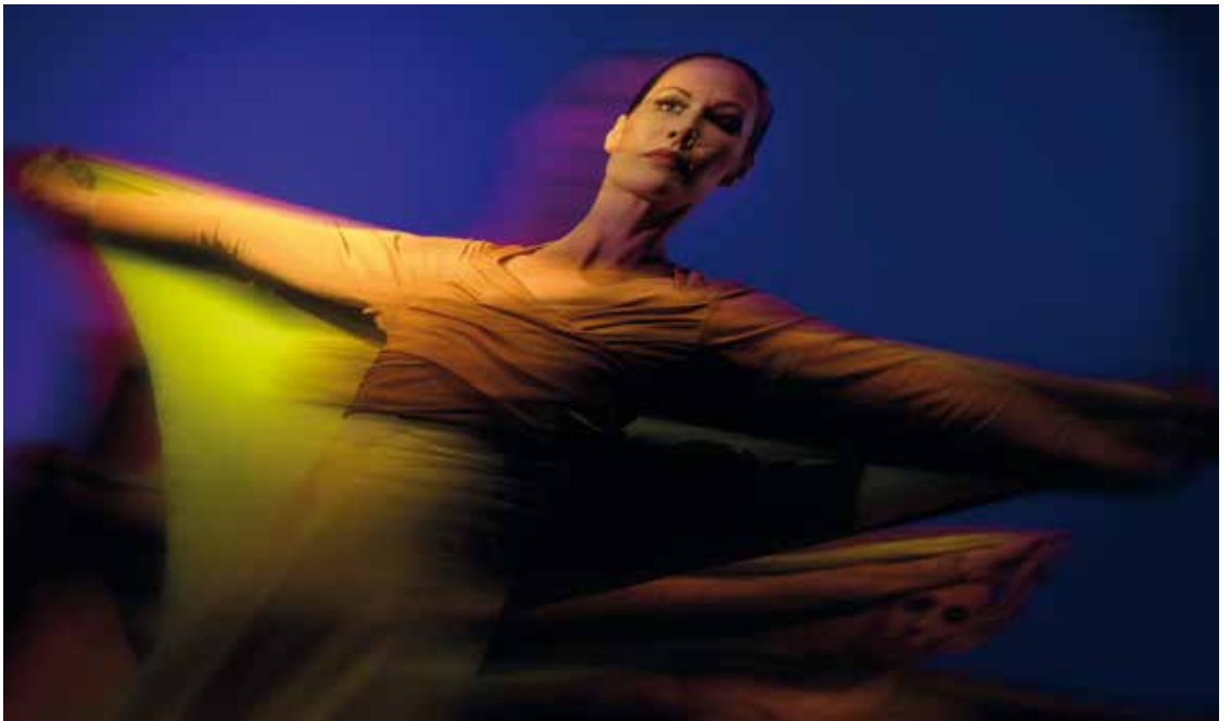
„Tüchertanz“ von Monika Rösler ↓