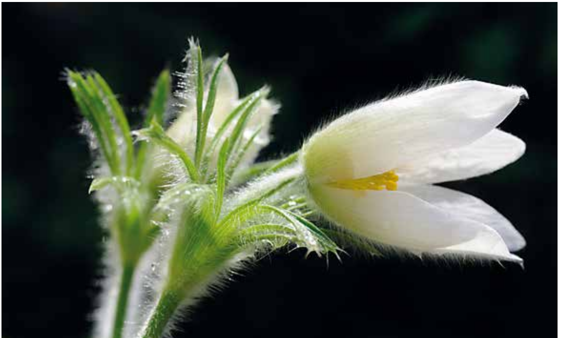
„Kuhsschelle“ von Gustav Flügel ↓