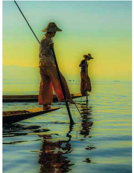
↑ „Fischer vom Inlay See“