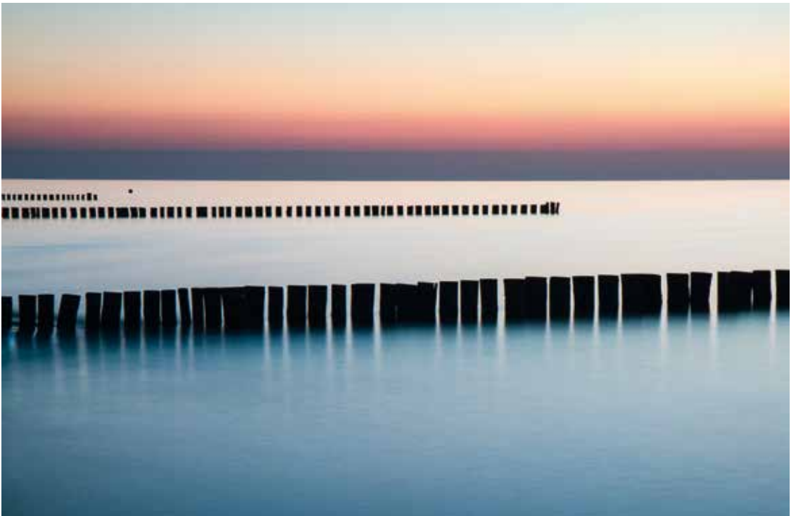
„Zingst“ von Klaus Dünn ↓