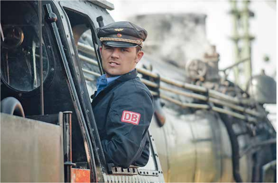
„Warten auf die Abfahrt“ von Dieter Eckert ↑