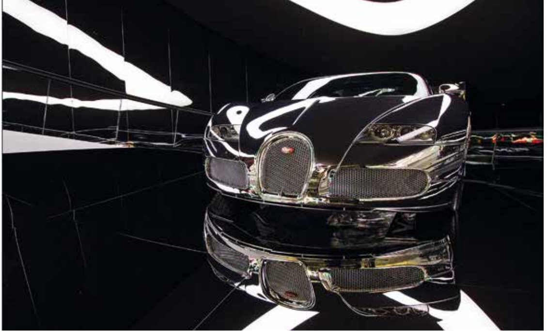
„Bugati“ von Klaus Dünn ↑