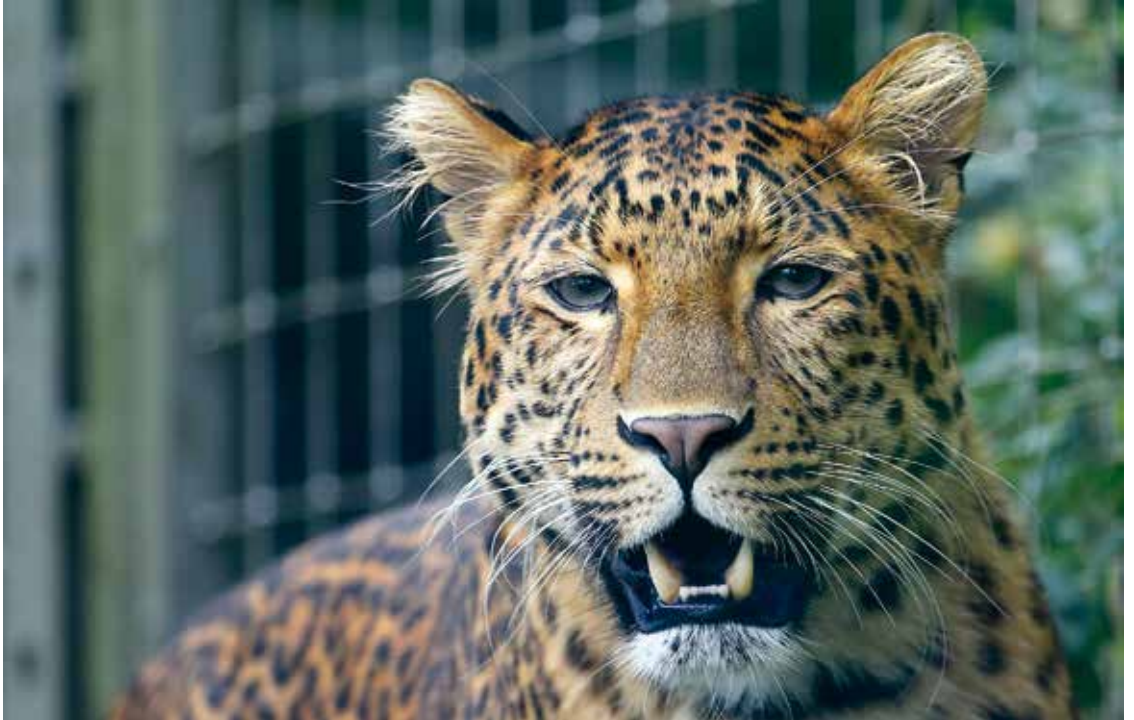
„Chinesischer Leopard im Tierpark Hellabrunn“ von Harald Wagner ↑