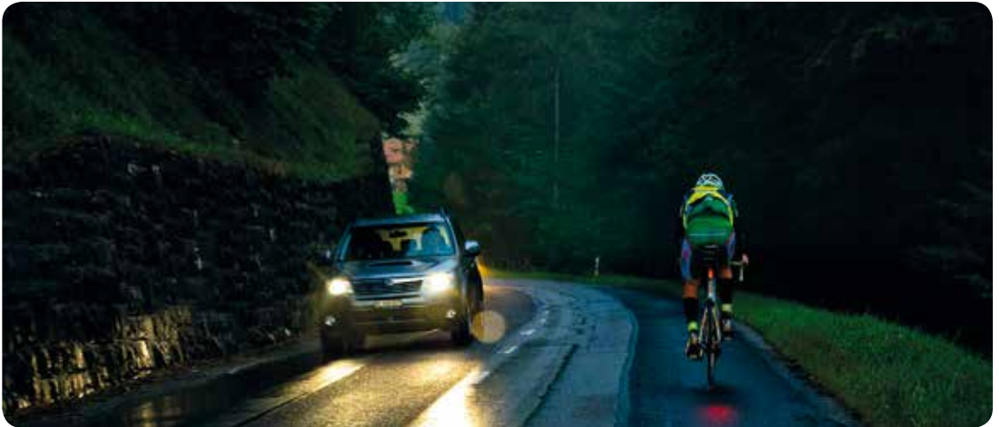
Norbert Huber fährt bei strömenden Regen in die Nacht.

Beide wurden zum Klubabend am 16.12. eingeladen. Sie werden kommen und können die Bilder kommentieren und Fragen beantworten.