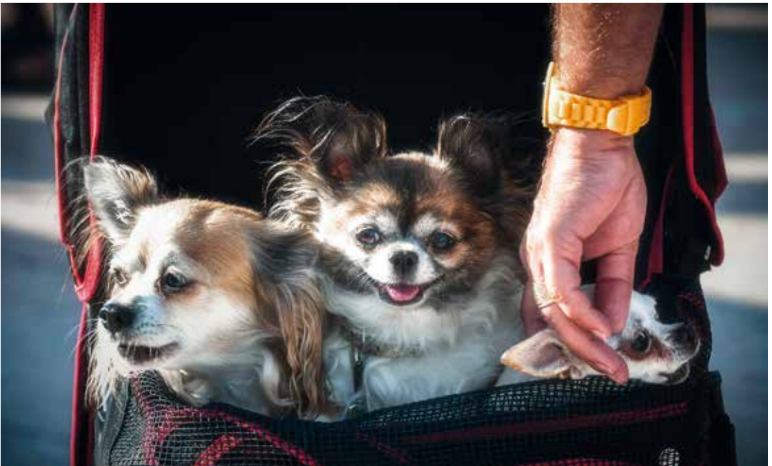
„Süßes Hundeleben“ von Gustav Flügel ↓