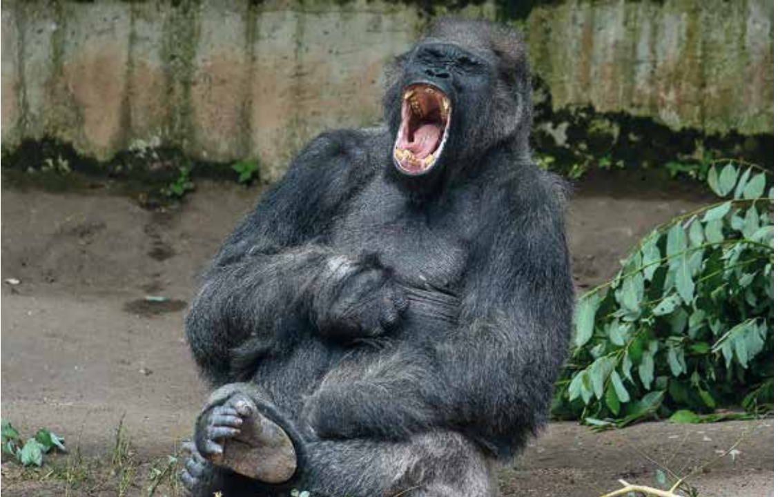
„Gorilla Fritz“ aus dem Nürnberger Tiergarten von Ulrike Reich-Zmarsly ↑