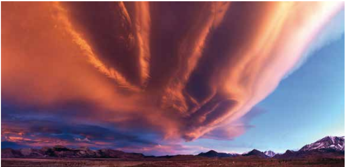
„Hinter dem Horizont“ von Robert Sprenger ↓